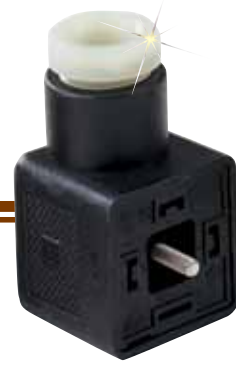
CX5300、 実物より 小さめ