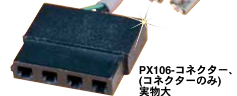
PX106-コネクター、 (コネクターのみ) 実物大

注文例：PX106-CONNECTOR、PX106トランスデューサー専用のコネクター CX106-4、コンタクトピン、1パック3個