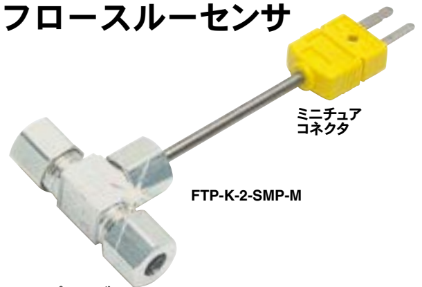
ミニチュア コネクタ